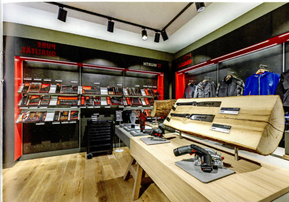
Ein Blick in den Würth Family Store in Stuttgart, den ersten Werkzeug-Markenshop. Ein Versuch, ein üblicherweise eher in der Stadtperipherie angesiedeltes Gewerbe mitten in die attraktive und zentrale Innenstadtlage zu holen.

balancieren. Schließlich nützt die exklusivste und extravaganteste Ausstattung nichts, wenn sie von niemandem als solche erkannt wird. Das Symbol muss lesbar bleiben. An die Shop-Gestaltung werden entsprechend hohe Anforderungen gestellt, was Flexibilität und Erweiterungsmöglichkeiten betrifft. Denn das Konzept einer Marke soll zwar wiedererkennbar, aber abwechslungsreich sein und optimalerweise Sinne auf mehreren Ebenen ansprechen. „Der Kunde hat immer mehr Möglichkeiten, und eigentlich sprechen wir nicht mehr von Bedarfskäufen“, sagt Matthias Hummel. Gerade in Konkurrenz zum Online-Geschäft stellt sich die Herausforderung, der Anonymität und dem Fehlen des taktilen Erlebens beim Internetkauf Erfahrungen entgegenzusetzen, die das Einkaufen in realen Läden mit echten Menschen attraktiv macht, wie Hummel erläutert: „Menschen als soziale Wesen wollen eigentlich mit anderen direkt kommunizieren und sich austauschen, Dinge spüren und erleben.“ Online ist dies nur beschränkt möglich, trotz ausgeklügelter Simulationen. „Wie hole ich meinen Kunden immer wieder ab? Das ist die Leitfrage. Es geht darum, Lebensgefühl zu verkaufen,